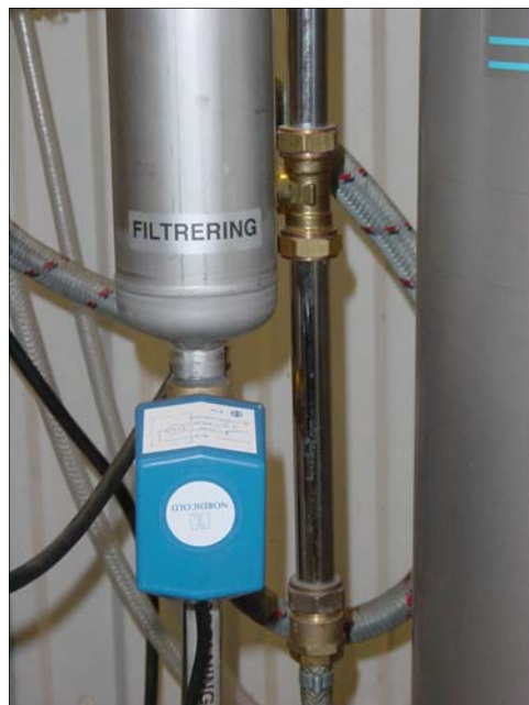
Reglermotor 2. Under syreprelaren.