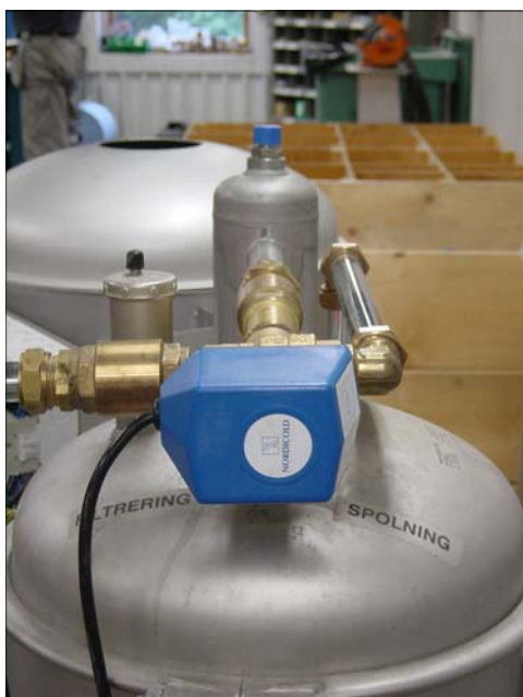
Reglermotor 1. På toppen av filtret.