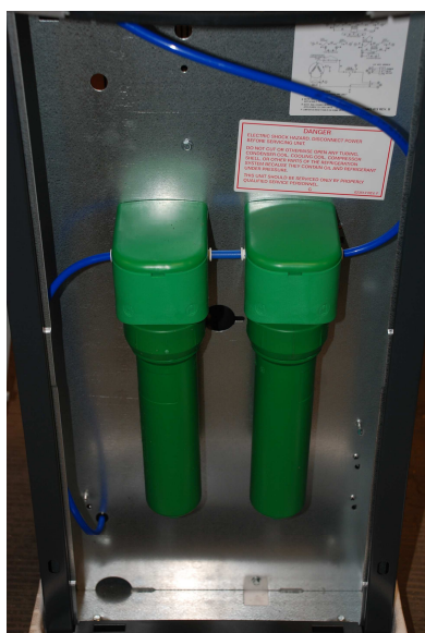
Filterhus med innehållande filterpatron, skall bytas var 6:e månad. Kol till vänster och sediment till höger.