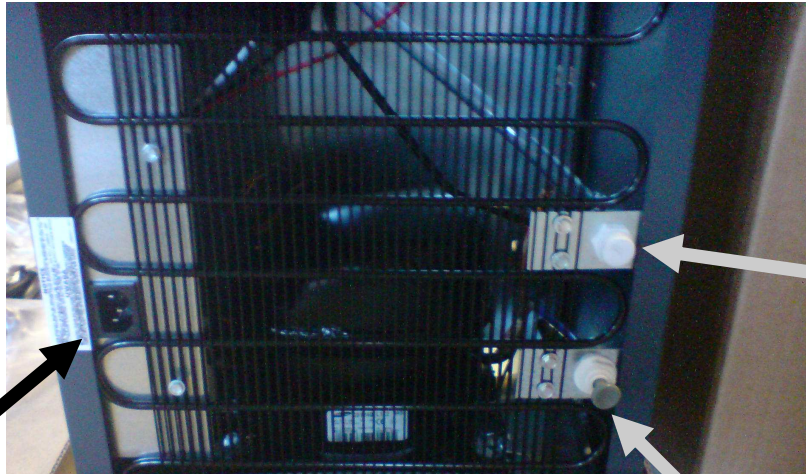
Anslutning el, 230 V.