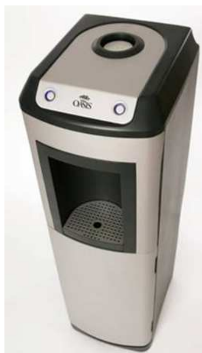
Knapp till vänster: Rumstemperatur