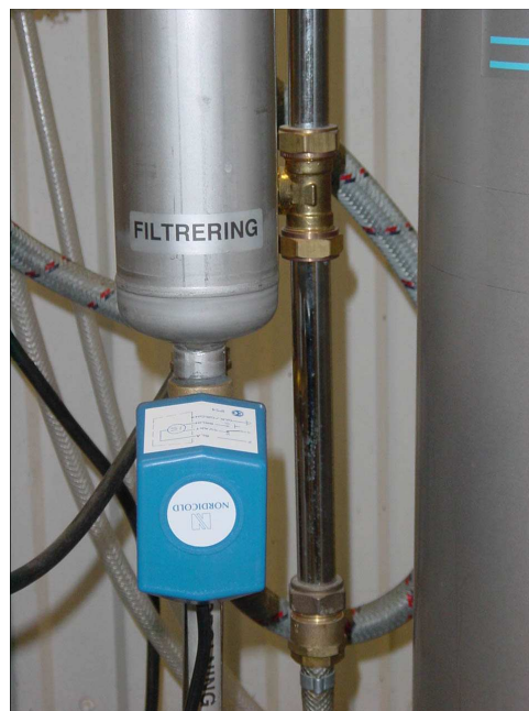
Reglermotor 2. Under syrepelaren.

Vid eventuella frågor kontakta Aqua Expert AB!