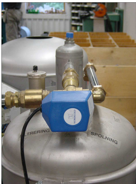
Reglermotor 1. På toppen av filtret.