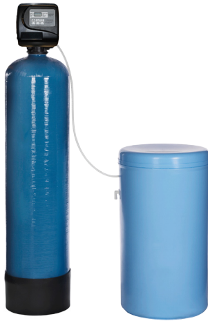
M40, M60, M80, M100