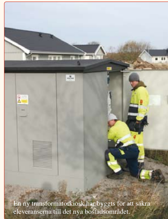
En ny transformatoriosk har byggts för att säkra elleveranserna till det nya bostadsområdet.