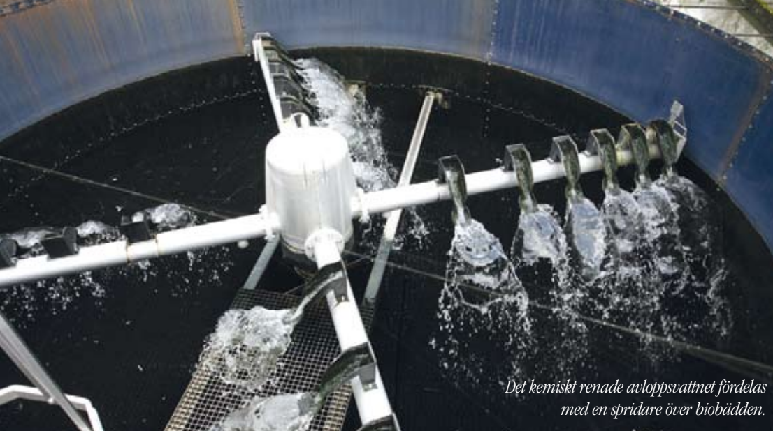
Det kemiskt renade avloppsvattnet fördelas med en spridare över biobädden.